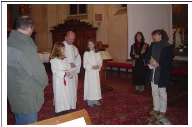
(Versprechen von Martina Reiter, OZ Vöcklabruck)