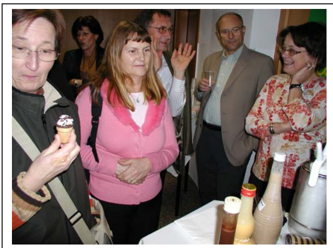
Begrüßung der TeilnehmerInnen beim Regionaltreffen Ost in Wien-Hasenleiten am 12.01.2007