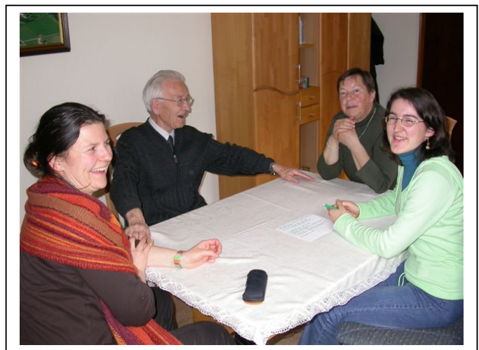
Kleingruppe beim Regionaltreffen West in Stams am 24.02.2007