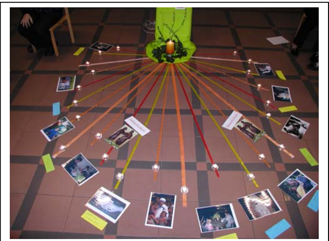
(Mitte beim Regionaltreffen Ost am 12.1.2007 in Hasenleiten)