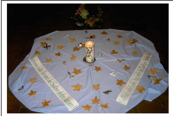
(Mitte beim Regionaltreffen in Graz)

Ein gesegnetes Weihnachtsfest und einen guten Beginn des neuen Jahres 2006 mit dem Don-Bosco-Monat Jänner wünscht allen der Provinzrat der SMDB