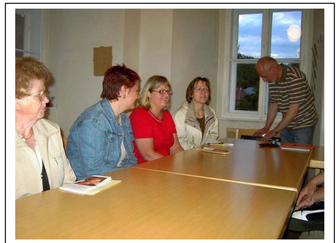
Ortstreffen in der Pfarre Viktring