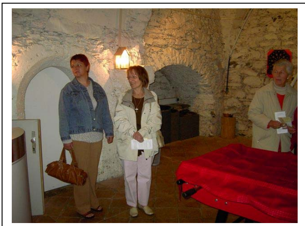
Besichtigung im Jugendkeller Viktring