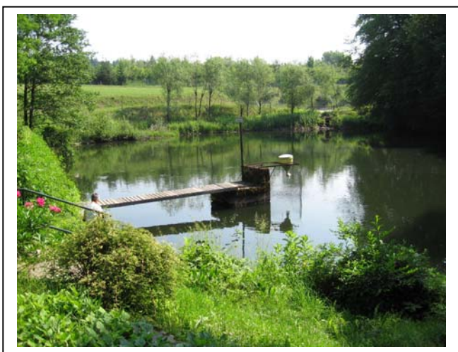
Fischteich beim Kloster